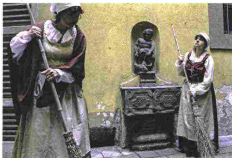
Le serve a Villa Arconati spazzano il cortile: il teatro riproduce la vita ottocentesca nella dimora

e cucine abitate da cuochi, erboristi e camerieri; il piano nobile, con l'Ala delle Donne che apre per l'occasione, il Salone Galliari, la Sala da Ballo. Gli ambienti di Villa Arconati, a Castellazzo di Bollate (Mi), rivivono domenica 28 dalla mattina alla notte due secoli del loro splendore. Magari sarà stata una vita splendida solo per i nobili proprietari, chissà se anche allora un cuoco poteva trovare il suo benessere ed essere contento di esprimere la sua arte culinaria come ai tempi nostri. L'Ottocento, quando la villa era abitata dalla famiglia Busca, va in scena dalle 11 alle 19 (7/5 euro) con l'interpretazione in costume dei mestieri per imbandire la tavola dei signori e una visita guidata alle 16 (4 euro). Il Seicento è protagonista alle 20,30 (15 euro) con lo spettacolo "Nobili e servi. Una storia lombarda", la storia del conte Galeazzo Arconati - che trasformò in villa di delizia il casamento medievale - e del figlio illegittimo, il frate domenicano Luigi Maria. Secondo la leggenda, fu per garantirgli un futuro che Galeazzo donò nel 1637 il Codice Atlantico di Leonardo alla Biblioteca Ambrosiana, fondata da suo cugino Federico Borromeo. www.villaarconati-far.it (f.f.)